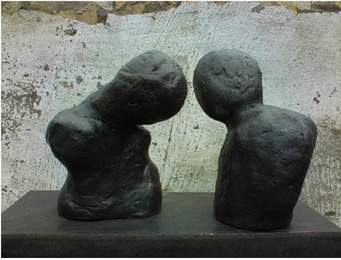
Bronze 10 cm hoog op sokkel 125 cm. (2003)